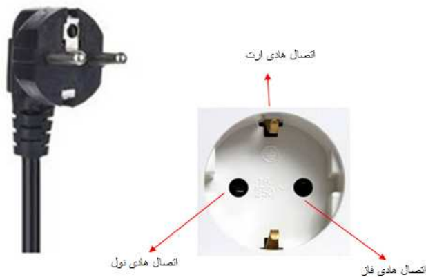
شکل (۳) - نحوی اتصال صحیح سوکت آزمون دستگاه

*متأسفانه برخی موارد رؤیت شده است که برق کار اشتباه هادی فاز را به ترمینال ارت در پریز متصل نموده است که در صورت اتصال تجهیز برقی می تواند بسیار خطرناک باشد.