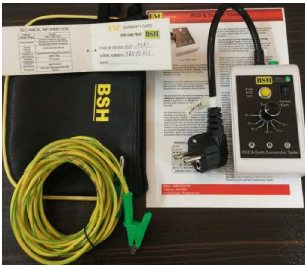
شکل (۱)-نمای بیرونی دستگاه تستر مدل BSH-7381

یکی از مزایای استفاده از این تستر بالا بردن سرعت عمل در آزمودن و بازرسی بدون نیاز به باز کردن مکانیسم پریز، بررسی سیستم ارتینگ منازل و جلوگیری از برق گرفتگی به دلیل خرابی کلیدهای نشستی جریان و یا قطع بودن سیم ارت در پریزها است.